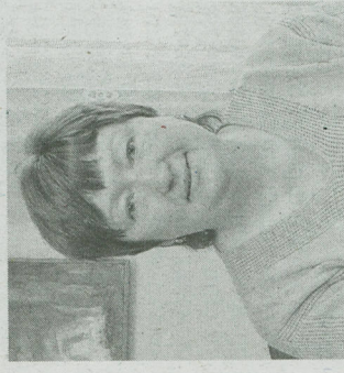
ŽIVOT v Sudějově popsal Marie Najbertová.

Sudějov – Sudějov je malá obec ležící nedaleko Uhlířských Janovic. V současnosti tam žije 77 obyvatel. Občané jsou poměrně mladí – jejich věkový průměr činí pouhých 39 let.